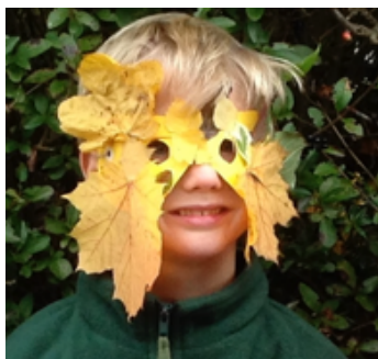
Green Man myths

Vyskúšajte Springboard Learning Arts Springboard - divoký tanec a Comedia del'arte.